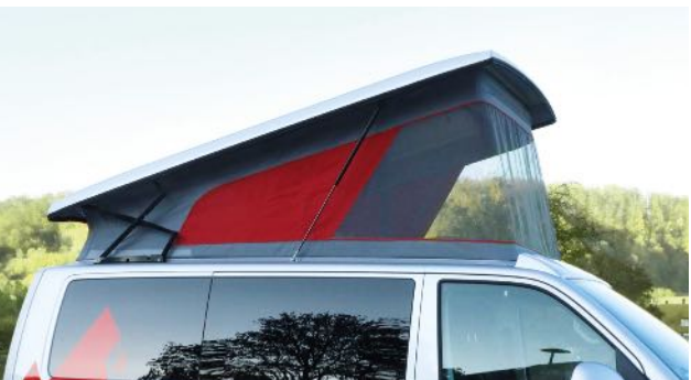
Facile à manipuler grâce à deux ciseaux à poser et quatre ressorts à gaz.

Le SCA-express-lock garantit le verrouillage sûr du toit et s'intègre parfaitement dans l'ambiance automobile du véhicule.