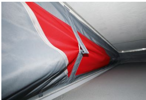
Le mécanisme de pliage tire automatiquement le soufflet de tissu vers l'intérieur lors de la fermeture de la coque de toit.