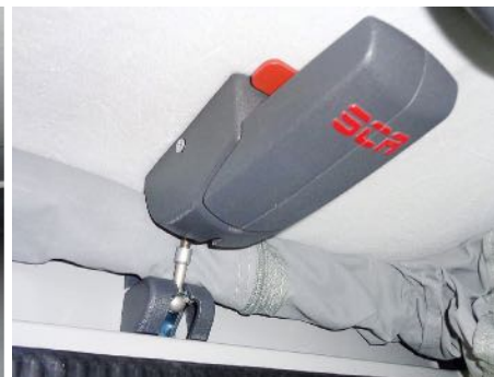
Le SCA-express-lock facile à utiliser.